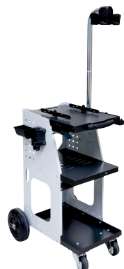
ref. 051331 + 052284 UNIVERSAL 800 + Arm med overheng