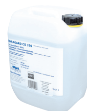
ref. 052246 Væske-kjøling CORAGARD CS 330 - 10 l